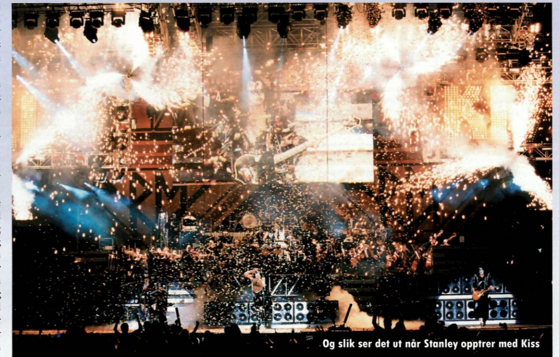
Oslik ser det ut når Stanley opptrer med Kiss

- Ja, den er svært personlig, for det er den filosofien som har brakt meg til hvor jeg er i dag, samt gjort Kiss til hva det er. Den omfavner og oppsummerer alt jeg står for. Hvis du ikke har tro på deg selv, hvem vil da ha det? Man må tro at man kan lykkes i det man gjør, og de som forteller deg at du vil feile er de som selv har